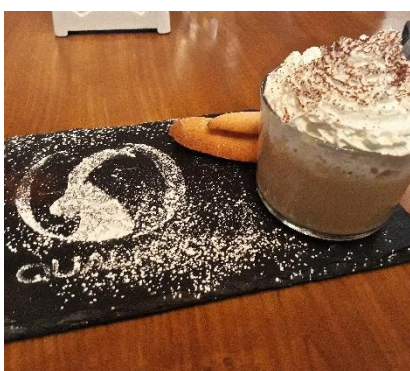
Tradizioni e qualità