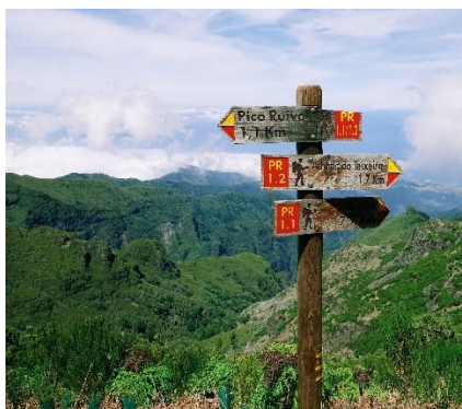
Panorama prima del Pico Ruivo