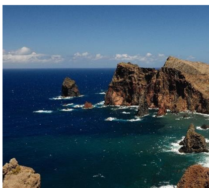
Punta Sao Lourenco