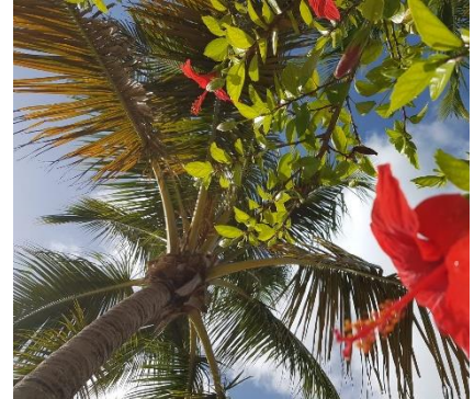
La variopinta flora locale