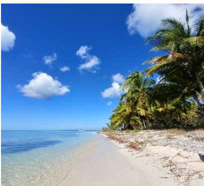
La splendida isola di Saona