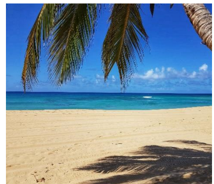
Spiagge da paradiso

~~~~~ Grazie alla lussureggiante vegetazione, alle spiagge di sabbia bianca, all'architettura coloniale ai tipici panorami da cartolina, la Repubblica Dominicana è considerata la location perfetta per girare serie tv e produzioni cinematografiche. In considerazione anche del fatto che lo scorso anno vi sono state girate 20 pellicole nazionali e 45 produzioni cinematografiche straniere può essere a ben ragione definita l'Hollywood dei Caraibi! I generi sono trasversali: dal drammatico alla fantascienza, dalla commedia al film storico, passando per i film d'azione: il minimo comune denominatore è la cornice di questo splendido Paese, con la sua storia e la sua gente. La capitale dominicana, Santo Domingo è stata scelta da Vin Diesel per girare il quarto episodio della serie "Fast and Furious", con rocambolesche gare automobilistiche, che sono al centro del soggetto cinematografico, in un crescendo di adrenalina, tensione e spettacolari effetti speciali per le strade della capitale. Altro esempio è "La fiesta del chivo", tratto dal romanzo omonimo dello scrittore peruviano Mario Vargas Llosa, dove la bellissima Isabella Rossellini è protagonista femminile. Altri grandi film girati tra le foreste vergini dominicane sono stati "Apocalypse Now", celeberrima la scena degli elicotteri che in realtà non sorvolano il Vietnam ma il Rio Chavón, "King Kong" e "Jurassic Park". Lo scorso anno Andy García, Eva Longoria e Forest Whitaker girarono qui le scene del film The Truth. ~~~~~