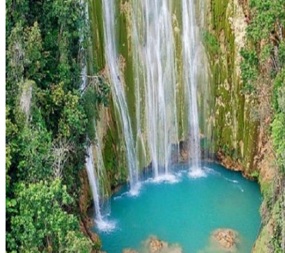
La cascata El Limon