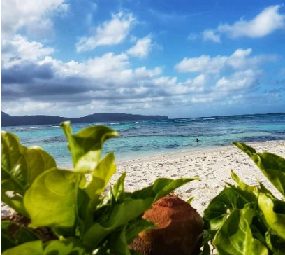
Le spiagge più nascoste