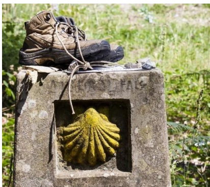
Il simbolo del Cammino di Santiago