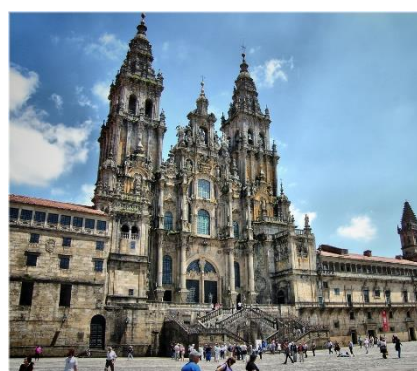
Cattedrale di Santiago de Compostela

La Capasanta o conchiglia di San Giacomo è il simbolo del Pellegrinaggio nella città di Santiago de Compostela. Il Pellegrino o "Peregrino" nel corso dei secoli ha da sempre raccolto sulle spiagge galiziane e sulla costa di Finis Terrae (in lingua galiziana Fisterra) le conchiglie di San Giacomo di Compostela.