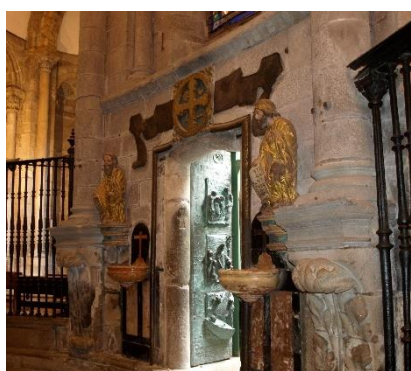
Interno della Cattedrale