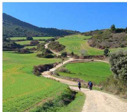
Cammino di Santiago