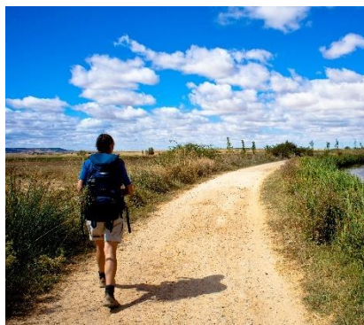
Lungo il cammino