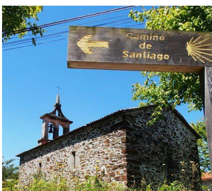
Cammino di Santiago