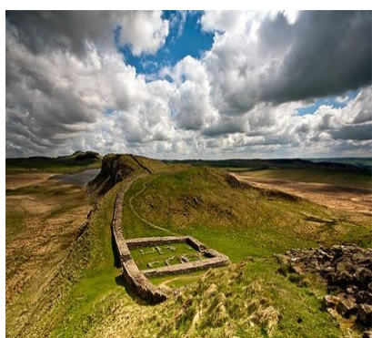
Vallo di Adriano