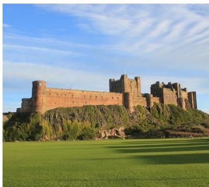
Castello di Bamburgh