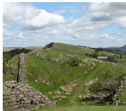
Il Vallo di Adriano