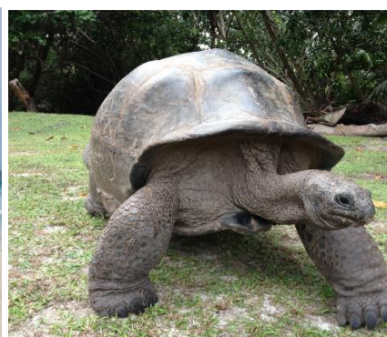
Tartaruga gigante a Curieuse