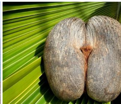
Coco de Mer