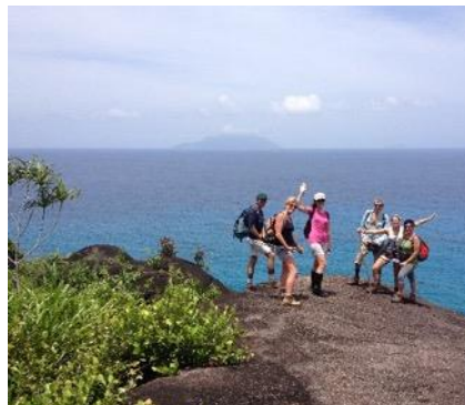
Trekking alle Seychelles