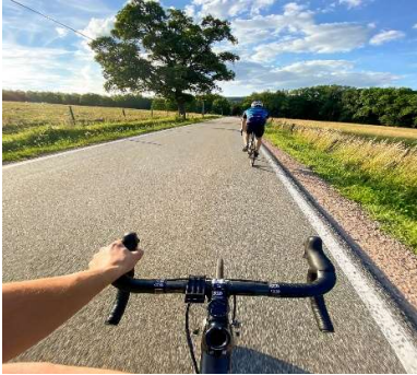
Pedalando in Salento