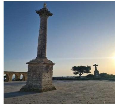
Santuario di Santa Maria de Finibus Terrae

~~~~~ Santa Maria di Leuca è sicuramente uno dei luoghi più suggestivi del Salento. Lontana circa 80 km dalla città di Lecce, già solo il percorso per raggiungerla è ricco di bellezza, sai per chi la raggiunge dal litorale che vede scorrere il mar Ionio da un lato e il mare Adriatico dall'altro, sia per chi la raggiunge dall'entroterra, fra olive secolari e vegetazione mediterranea.