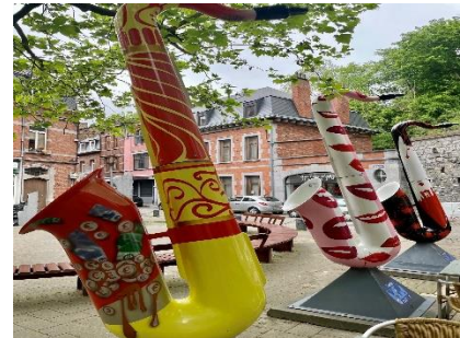
Arte a Dinant